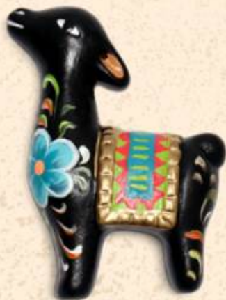
↑ Vicuña 7 x 4 cm