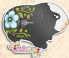
Cuy 6.2 x 5.3 cm