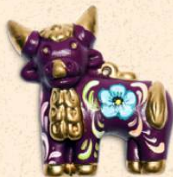
↑ Torito de Purará 5 x 5 cm