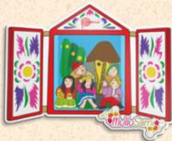
Retablo 6.5 x 8 cm