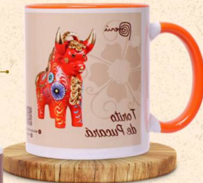
Diseño Torito de Pucará