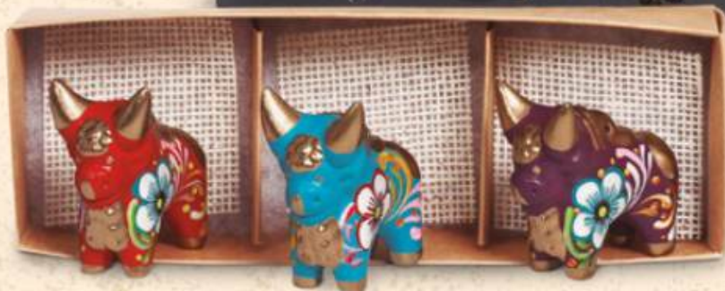
Set de 3