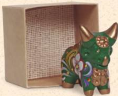
Set de 1