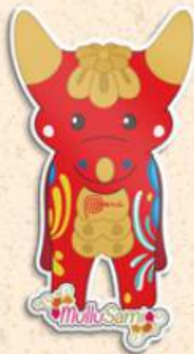
Cruz del viajero 8 x 5 cm