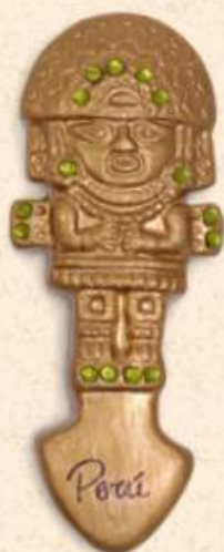
↑ Tumi 8 x 3 cm

Presentación de piezas imantadas para usos múltiples.