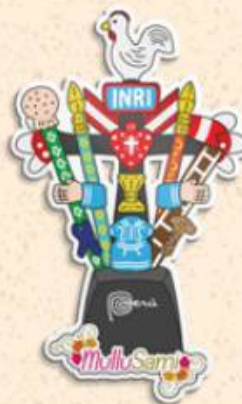
Torito de Pucará 8 x 4.4 cm