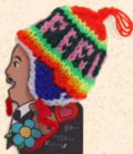
↑ Ekeko 5 x 5 cm