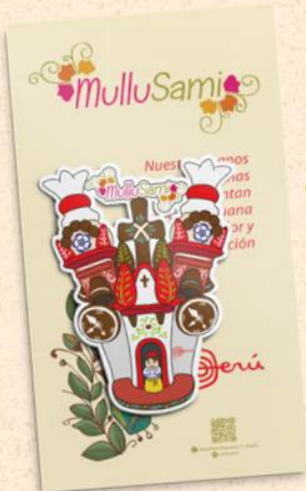
Iglesia Ayacuchana 7.3 x 5.7 cm