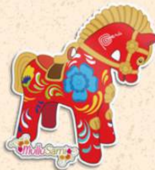
Caballo 7.5 x 7 cm