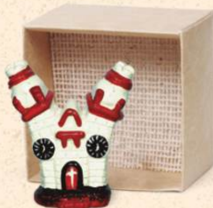
↑ Iglesia Ayacuchana 5 x 5 cm