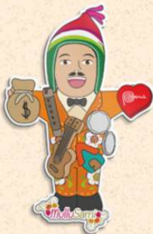
Ekeko 10 x 6.6 cm